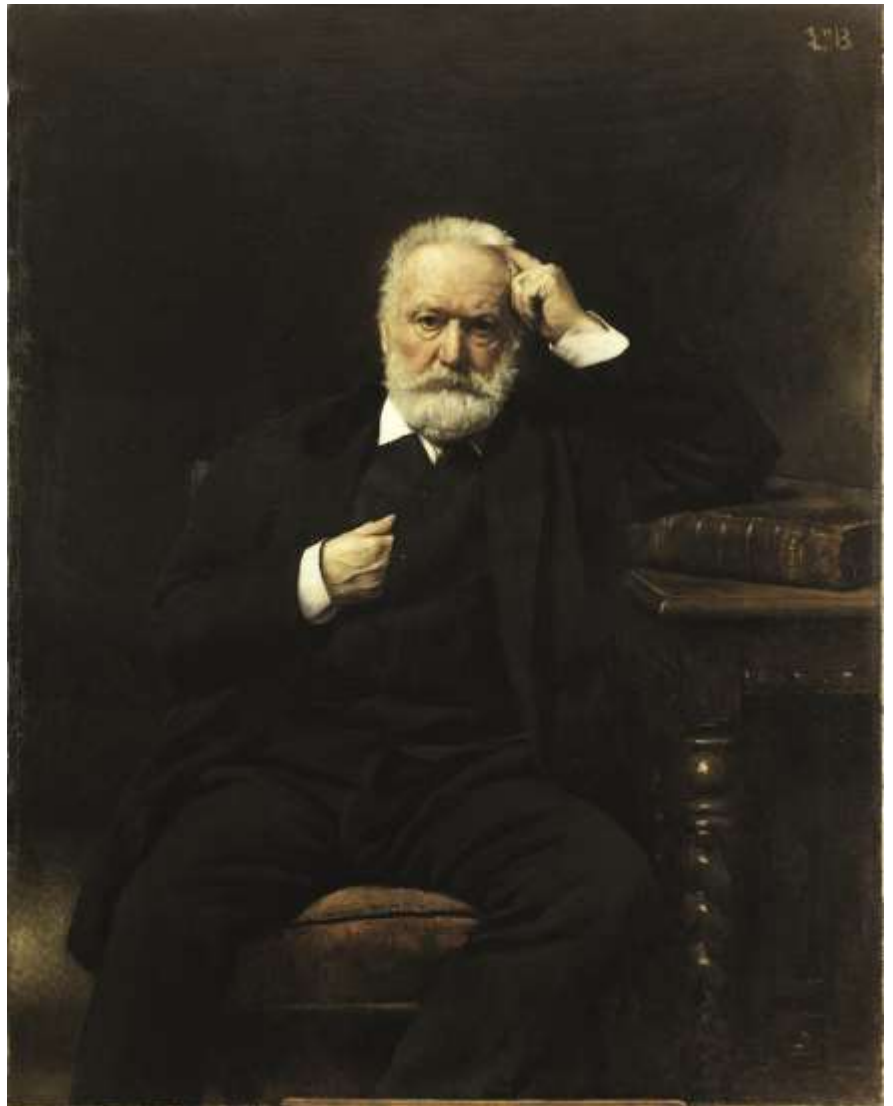
Peinture à l'huile (1879) de Léon Bonnat (Musée national du château de Versailles).

Victor Hugo occupe une place marquante dans l'histoire des lettres françaises au xix e siècle. Il est poète lyrique avec des recueils comme Les Contemplations , poète engagé contre Napoléon III dans Les Châtiments , poète épique avec La Légende des siècles , mais il est également un romancier du peuple qui rencontre un grand succès populaire avec Notre-Dame de Paris et plus encore avec Les Misérables .