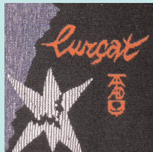
Signature de l'artiste et de l'atelier d'exécution, ici atelier Tabard.

« Vous avez sous les yeux une œuvre qui est le fruit du travail d'un peintre secondé par une équipe d'exécutants, les ouvriers tapissiers de la Creuse. »