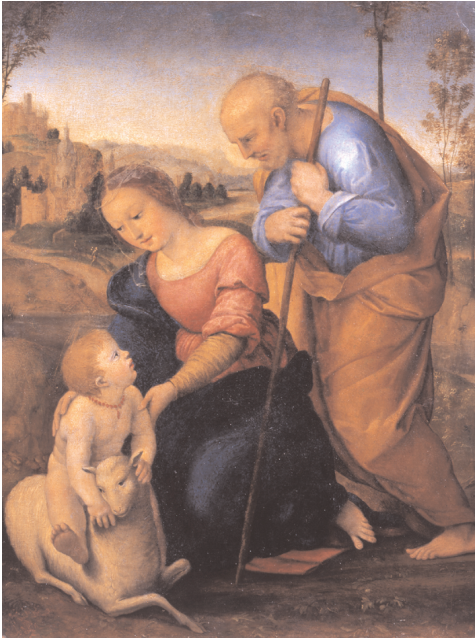
Raffaello Sanzio dit Raphaël (atelier de), La Sainte Famille à l'agneau ou La Madone à l'agneau , vers 1504, huile sur bois, 29 x 21 cm